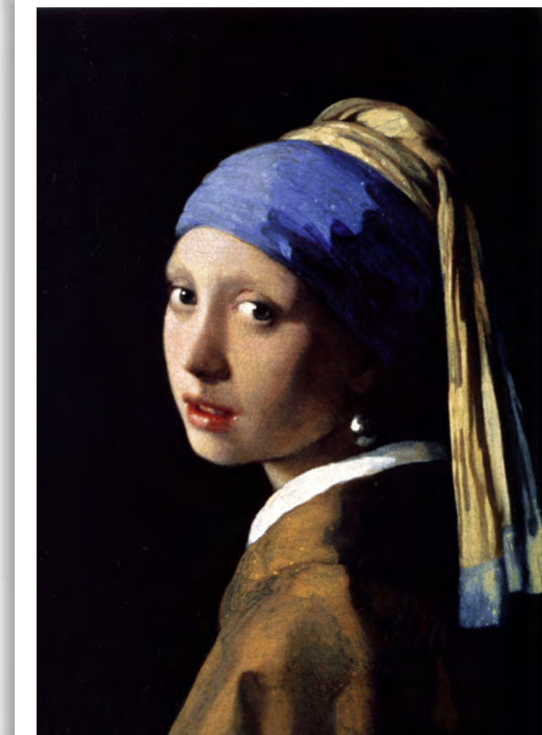
«Девушка с жемчужной сережкой», Ян Вермеер (ок. 1665). Другие полотна Яна Вермеера — на выставке «Эпоха Рембрандта и Вермеера. Шедевры Лейденской коллекции» в ГМИИ им. А.С. Пушкина (27.03–22.07).

Текст ПОЛИНА ЧЕСОВА