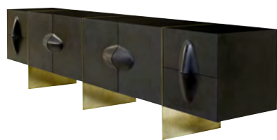
Комод от Brian Thoreen с фасадом из каучука имеет внутреннюю отделку красного цвета и латунное основание, которое перекликается с блеском изображенных на картине тканей.